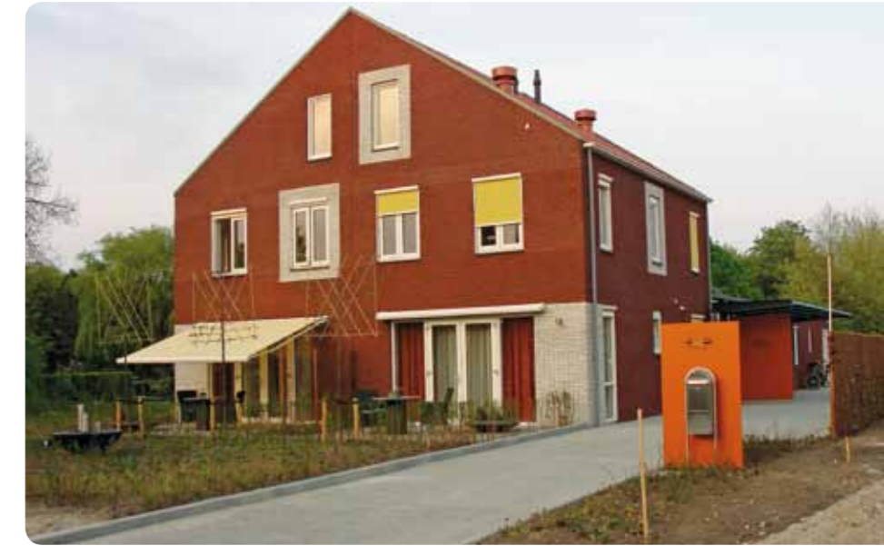
Hospice de Schutse (vooraanzicht)

'Begrijpelijk waren de eerste reacties afwachtend. Mensen wisten niet goed wat ze konden verwachten en maakten zich zorgen nu er hele zieke mensen in het huis zouden worden opgenomen. Wat betekende dat bijvoorbeeld voor de kinderen in de straat;