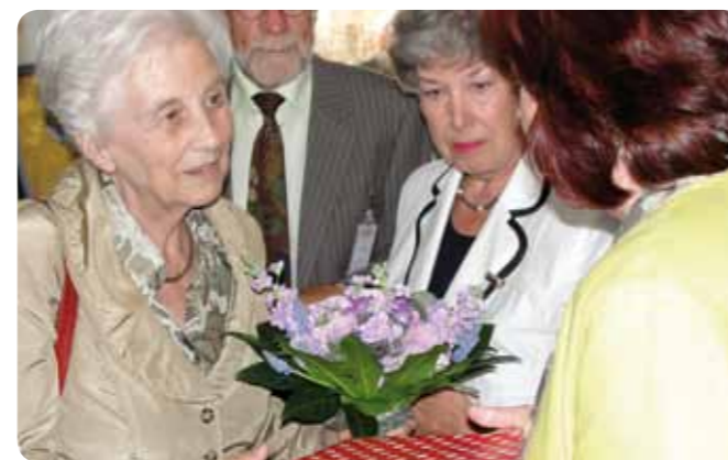
Mevrouw E. Borst, voormalig minister van Volksgezondheid, verklaarde het hospice voor geopend.

'We hebben heel veel fondsen en verschillende partijen aangeschreven. In totaal zijn er vijftientig brieven verstuurd. In eerste instantie ontvingen we veel afwijzingen. Toch zijn we, met een klein startkapitaal, gestart met de bouw. Al snel nadat we met de bouw waren begonnen, kregen we de eerste toezeggingen. Zo konden we heel gericht gelden beschikbaar maken, die we lieten aansluiten op de verschillende ruimtes in het huis. Een voorbeeld hiervan is de inrichting van de stiltekamer door Monuta. Uiteindelijk zijn alle ruimtes in het huis op deze manier gefinancierd. Groninger Huis