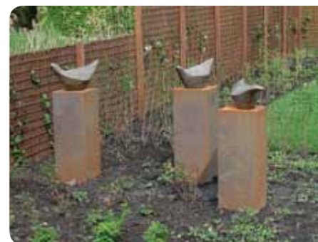
Tuinaanleg van het hospice is aangeboden door Woonstichting Groninger Huis

'Het kan natuurlijk niet missen, maar wij zijn heel erg Zuinig op ... onze vrijwilligers. Daar moeten we het toch van hebben. Zonder hen kunnen we niet de zorg bieden waar we voor staan. En dat dát steeds weer lukt, daar zijn we heel erg trots op. Persoonlijk ben ik Zuinig op ... de mensen die dicht bij mij staan en dat we het goed met elkaar hebben.'