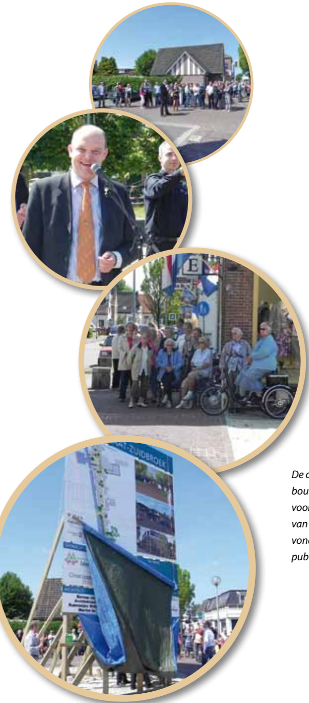
De onthulling van het bouwbord, het startschot voor de herinrichting van de Spoorstraat, vond plaats onder grote publieke belangstelling